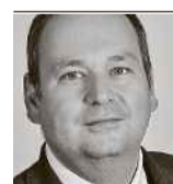
von Bojan Stula

Die enorm hohe Zustimmung zur Steuersenkung zugunsten von Wohneigentümern mag auf den ersten Blick überraschen, lässt sich aber verhältnismässig leicht erklären: Erstens stand diese Vorlage im Schatten der Prämieninitiative, eine eigentliche Kontroverse im Abstimm-