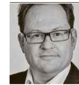
von Hans-Martin Jermann

In typisch schweizerischer Manier haben die Baselbieterinnen und Baselbieter über die SP-Initiative entschieden: Mit ihrem Nein stellten sie ihr Verantwortungsgefühl gegenüber dem Staatshaushalt über das eigene Portemonnaie. Hätten gestern alle Stimmbürger nach persönlicher Profitmaximierung gehandelt, so wäre ein Ja herausgekommen.