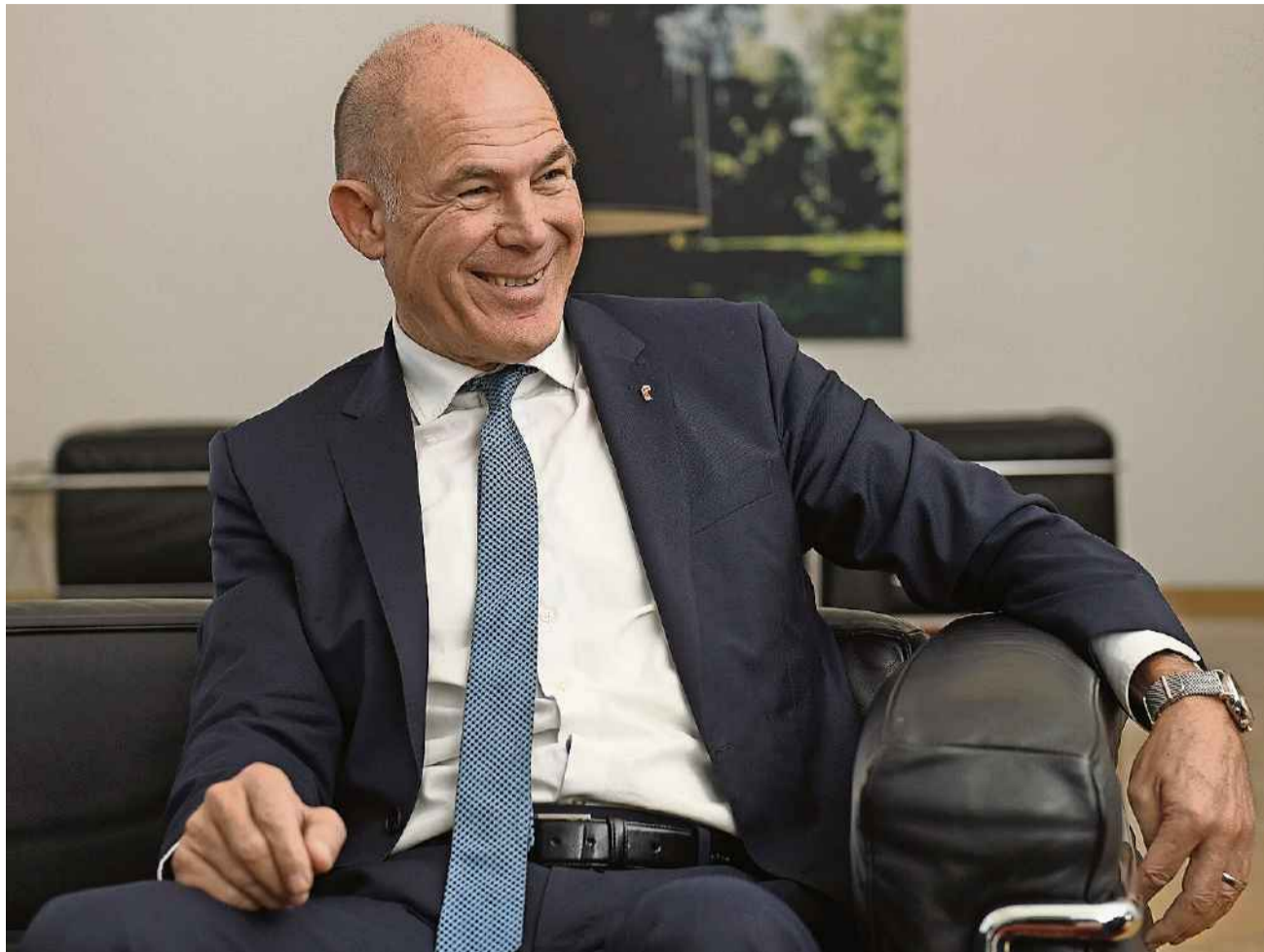
Anton Lauber freut sich über das Nein zur Prämieninitiative. Neue Forderungen könnten ihm die Laune aber bald verderben. JUN

Um 75 Millionen Franken wollte die Initiative die vom Kanton ausbezahlten Prämienverbilligungen erhöhen; damit sollte gewährleistet werden, dass kein Haushalt mehr als 10 Prozent des massgebenden Einkommens für Krankenkassenprämien ausgeben muss. Einer der Gewinner des Abstimmungsabends, Finanzdirektor Anton Lauber (CVP) analysierte das Volksnein ähnlich: Viele Abstimmende seien wohl überzeugt gewesen, dass 75 Millionen eine zu hohe Belastung für den Staatshaushalt darstelle. Zumal Bruttoeinkommen bis zu 150 000 Franken von der Initiative profitiert hätten. «Die Bevölkerung hat erkannt, dass mit höheren Prämienverbilligungen nur